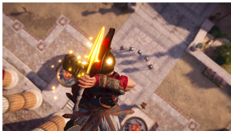
Assassin's Creed Odyssey – Reveal Trailer (E3 2018)