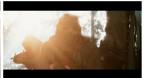
Ghost Recon Breakpoint – We Are Brothers (E3 2019)